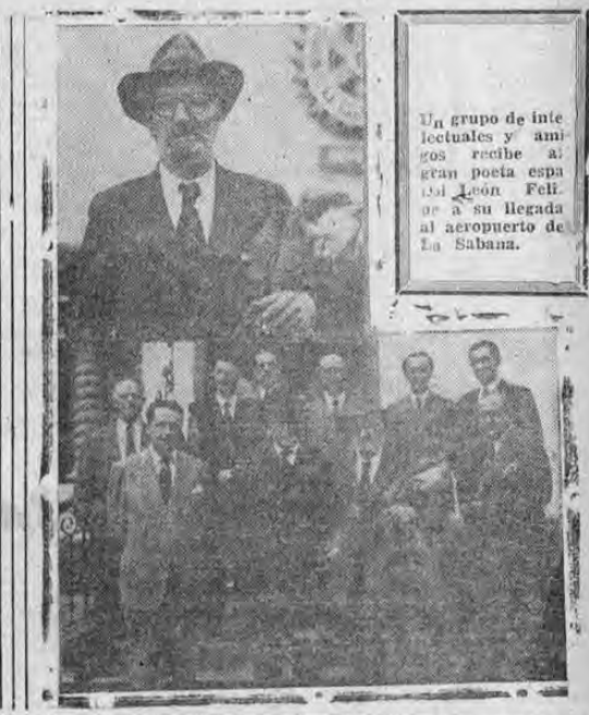
Un grupo de intelectuales y amigos recibe al gran poeta español León Felipe a su llegada al aeropuerto de La Sabana.

Estamos conversando con León Felipe, rodeando el poeta nos hallamos Arturo Echeverría, Fernando Luján y el redactor. Encendimos un cigarrillo. En la suava penumbra del salón, la luz de las velas chisporroteante del fósforo se quiebra en la angustiosa mirada apenas perceptible de las gafas del poeta, quien enciende tam-